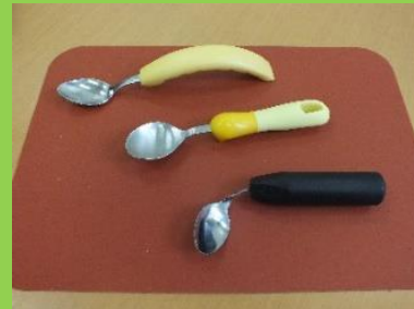
ユニバーサルデザインスプーン

柄が握りやすく、上下左右に曲げることもでき、自分で使いやすい向きや角度に調整できます。