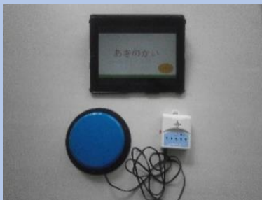
なんでもワイヤレス