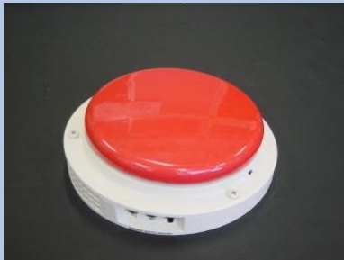
ビックマックススイッチ