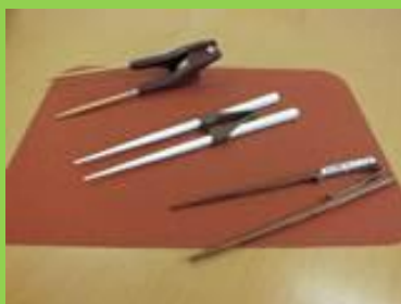
ユニバーサルデザイン箸

柄が握りやすく、上下左右に曲げることもでき、自分で使いやすい向きや角度に調整できます。