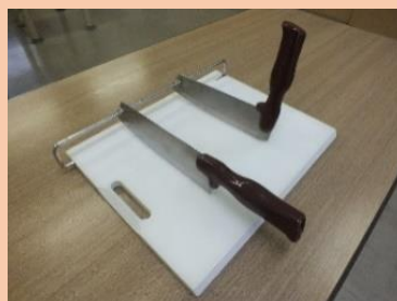
ユニバーサルデザイン包丁

ハンドルの向きや角度を変えられる包丁や、まな板に刃先が固定されていて安全に使える包丁などがあります。