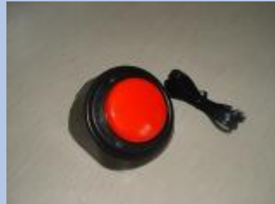
ステップバイステップ