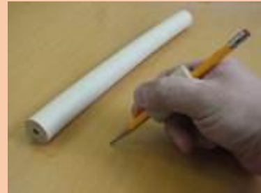
フォームチューブ