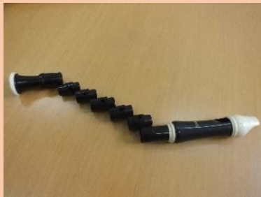
指の不自由な人のための リコーダー